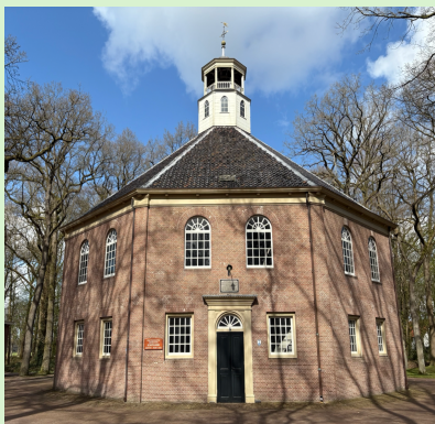
Foto: St. Hinsz-orgel te Roden

In 1825 werd bij koninklijk besluit een bedrag van fl.20.693,00 beschikbaar gesteld voor het bouwen van een Hervormde Kerk in Veenhuizen met apart staande pastorie. Er was plaats voor 612 mensen. De kerk werd gebouwd als Waterstaatskerk naar het voorbeeld van de Koepelkerk in Smilde en is uniek vanwege haar achtkantige koepel met inwendig koepelgewelf op Toscaanse zuilen en een rondgaande galerij.