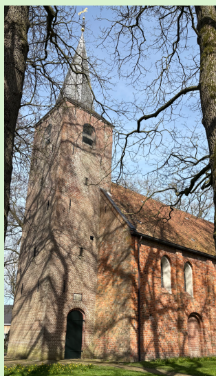
Foto: St. Hinsz-orgel te Roden